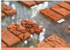
⬇ Tijolo. 2025 "Built to Break" de/by Maria Rodionova Loram