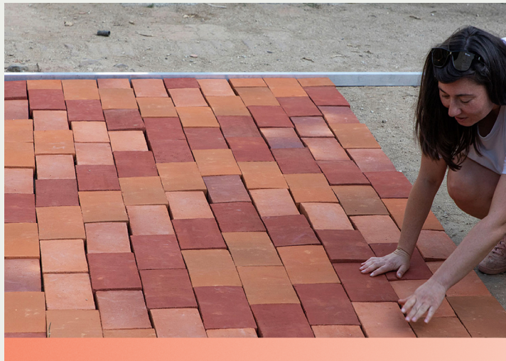
⬇ Tijolo. 2023 "Kilim From the Klin" de/by Katarina Zivkovic