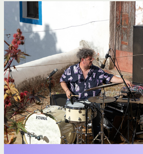
⬇ Cidade PreOcupada Edições anteriores/Past editions